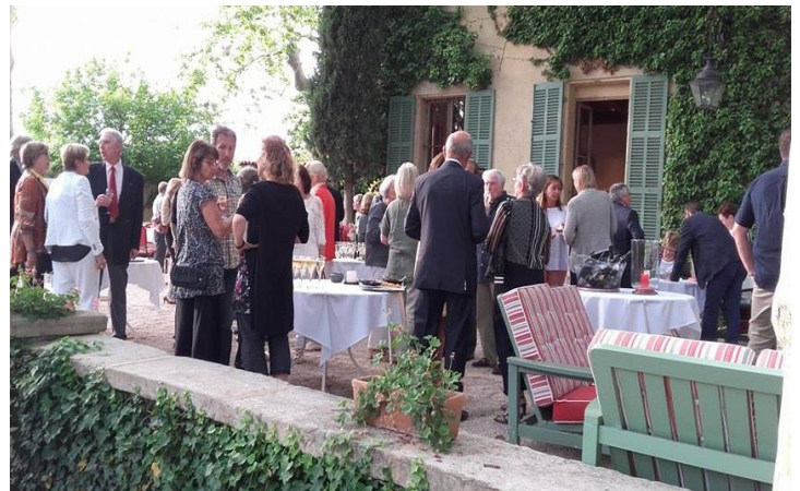
Passation de Présidence

Nous avons eu la possibilité de présenter succinctement notre projet de Pobé et de remercier ce fidèle partenaire